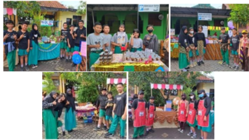
Gambar 2. Pelaksanaan Bazar Inovasi SD Negeri Pepe Sedati

Sebelum tahap ini dilakukan, siswa dalam kelompok melakukan persiapan bazar inovasi yaitu dengan menghias atau menata tempat/meja yang sudah disediakan. Kegiatan jual beli dari seluruh kelas VI bertempat di halaman sekolah pada jam istirahat I pukul 09.00-10.00 WIB. Dalam hal ini guru hanya mengawasi/mendampingi saja, serta dibantu dengan dukungan paguyuban wali siswa kelas VI SD Negeri Pepe Sedati. Berikut adalah pelaksanaan jual beli Bazar Inovasi Makanan dan Minuman: