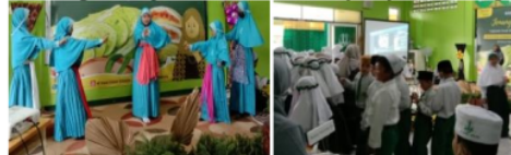
Gambar 3. Pentas Perwakilan Acara Kidzpreneur MI Darul Hikam Waru

Pelaksanaan kidzpreneur dimulai pukul 07.00 WIB. Antar siswa dalam kelompok berkerjasama mempersiapkan barang jualannya. Peran siswa dibagi menjadi 2 yaitu pembeli dan penjual. Bagi pembeli terdapat sesi menonton tayangan belajar bersama sesuai provinsi yang ditentukan dan menonton pertunjukkan tari dan nyanyian dari perwakilan kelas.