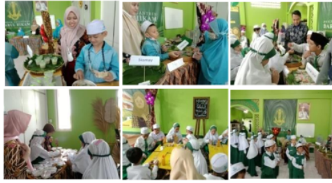
Gambar 4. Pelaksanaan Kidzpreneur di MI Darul Hikam Waru